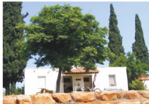
בית קיבוץ.

"מדובר פה באמירה בלתי מבוססת, מבחינה משפטית, מבחינה חברתית, מבחינה ארגונית ומבחינה כלכלית. שיוך דירות איננו יכול להיות תהליך פנימי, במובן הזה שהקיבוץ והחברים עושים מה שהם רוצים. מינהל מקרקעי ישראל מעולם לא נתן את הסכמתו למהלך מסוג זה, והוא איננו אפשרי לפי החוזה שיש עם המינהל. מה שאפשרי הוא שיוך, שבו, בסופו של דבר, הקיבוץ מפנה את החברים למינהל לחתום על חוזה חכירה, מה שנקרא בעגה